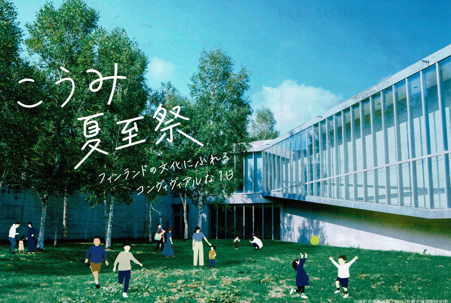
小海町高原美術館、設計:安藤忠雄建築研究所